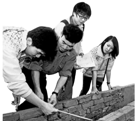
베트남에서 현지 주민들과 함께 관개수로 작업을 진행하고 있는 코이카 관리요원

지난 2월 20일 파라과이 수도 아순시온 집 무실에서 만난 페데리코 프랑코 부통령은 한국과 파라과이의 반세기 인연부터 얘기했다. 한국 원조에 대한 감사의 말 이면엔 한국의 고도 성장에 대한 질투도 섞여 있는 듯했다. 50년 전 농업이민을 보냈던 한국이 이제는 파라과이에 무상원조를 하는 개발원조위원회(DAC) 19개국 중 4위(2010년 1163만 달러 규모)의 부국으로 성장했기 때문이다.