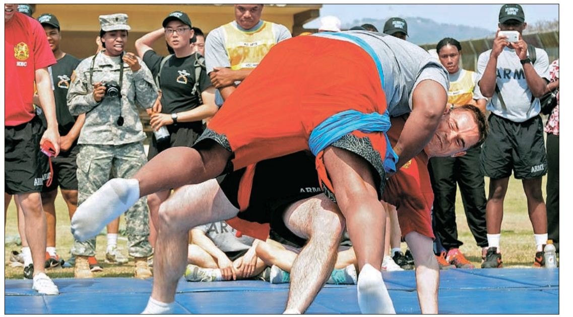
내가 미8군 천하장사 '한-미 친선 주간'을 맞아 서울시는 주한 미군·군무원과 외교관 가족 등 200여 명을 초청해 17일 주한 미8군 한국군지원단 용산지역대에서 전통문화 체험행사를 열었다. 이날 열린 씨름대회에서 주한미군이 씨름을 하고 있다.

초·중·고생 5명 중 1명은 지난해 학교폭력 피해를 당한 것으로 나타났다. 또 이들 피해 학생 10명 가운데 3명은 자살을 고려하기도 했다. 17일 청소년폭력예방재단이 발표한 ‘2011 학교폭력 실태조사’에 따