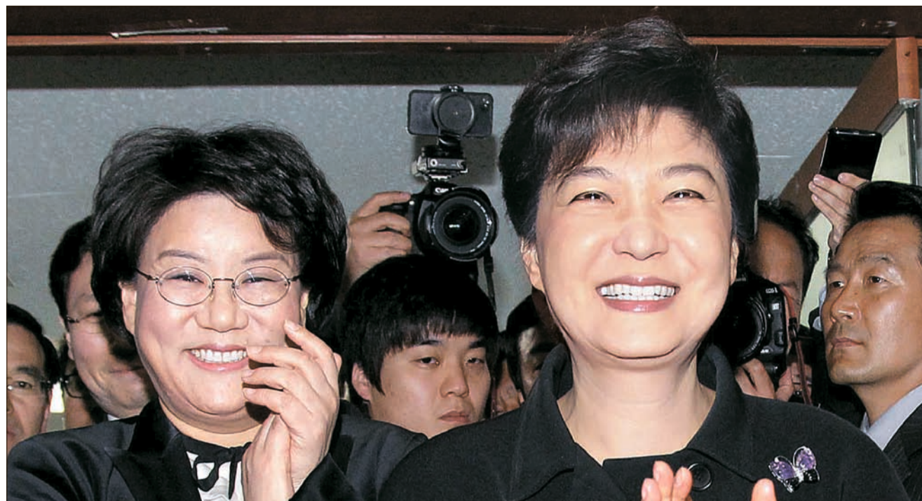
새누리당 박근혜 선거대책위원장이 12일 여의도 당사에서 기자회견을 마치고 나오며 이해훈 총합상향실장(왼쪽)과 박수를 치고 있다.