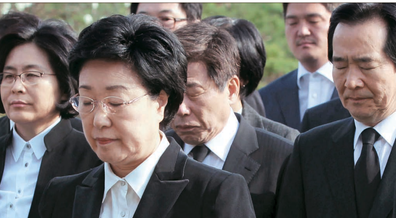
한명숙 민주당 대표(가운데)가 12일 서울 동자동 국립현대미술관의 김대중 전 대통령 묘소에 한화한 뒤 참배하고 있다.