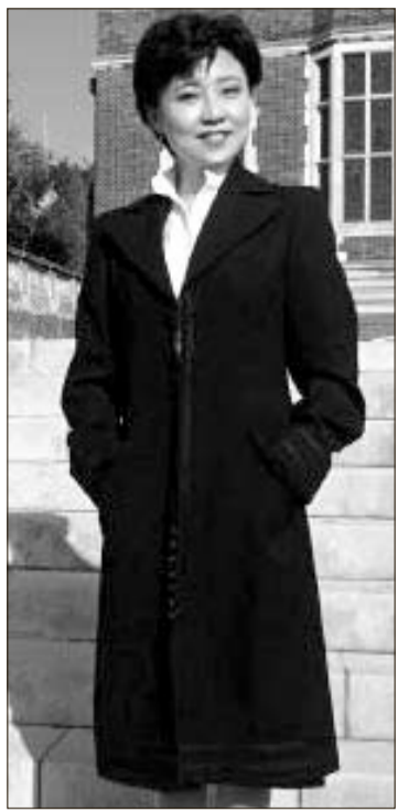
중국판 '재클린 케네디'로 불리는 구카이라이 여사.