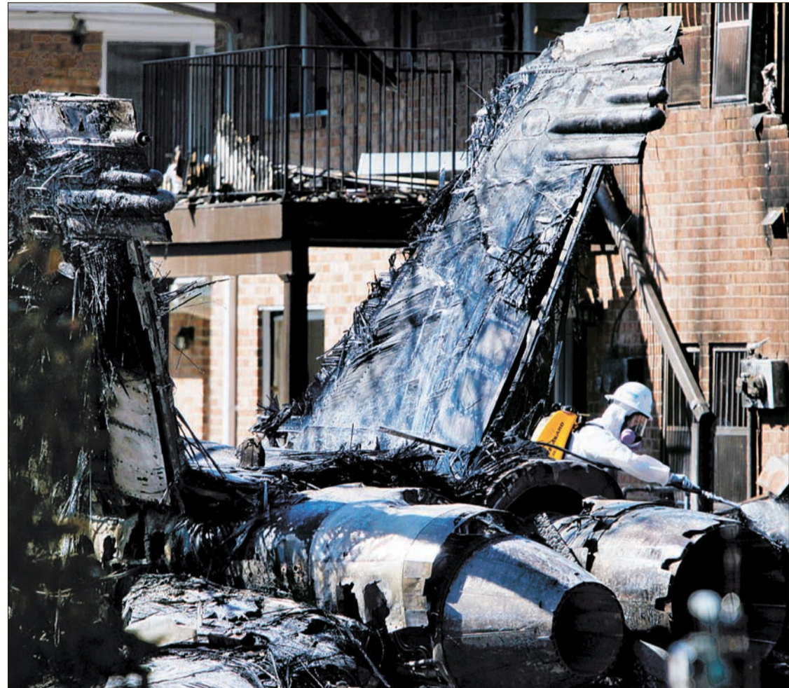
6일(현지시간) 오후 미국 버지니아주 아파트 단지에 추락한 미 해군 F/A-18D 호넷 전투기의 잔해. 현지 언론은 "두 조종사가 탈출해 목숨을 건진 것은 기적 같다"고 보도했다. 이번 사고에 대해 미 해군은 어떤 입장도 밝히지 않았다. [버지니아비치 AP=연합뉴스]