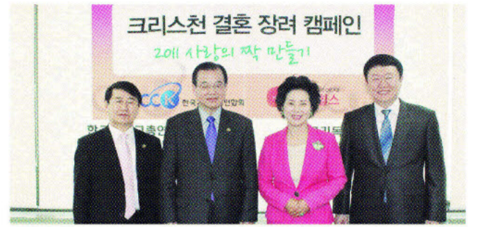
한국기독교총연합회와 레드힐스가 크리스천 결혼장려 캠페인을 통해 심글 크리스천들에게 희망을 전하고 있다.

업계 최초로 레드힐스가 1,200만 기독교 교단과 단체의 대표 연합기관인 ‘한국기독교총연합회’와 손을 잡고 ‘크리스천 결혼장려 캠페인’을 진행하고 있다.