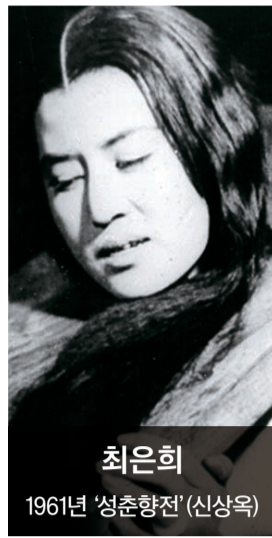
최은희 1961년 '성춘향전' (신상옥)