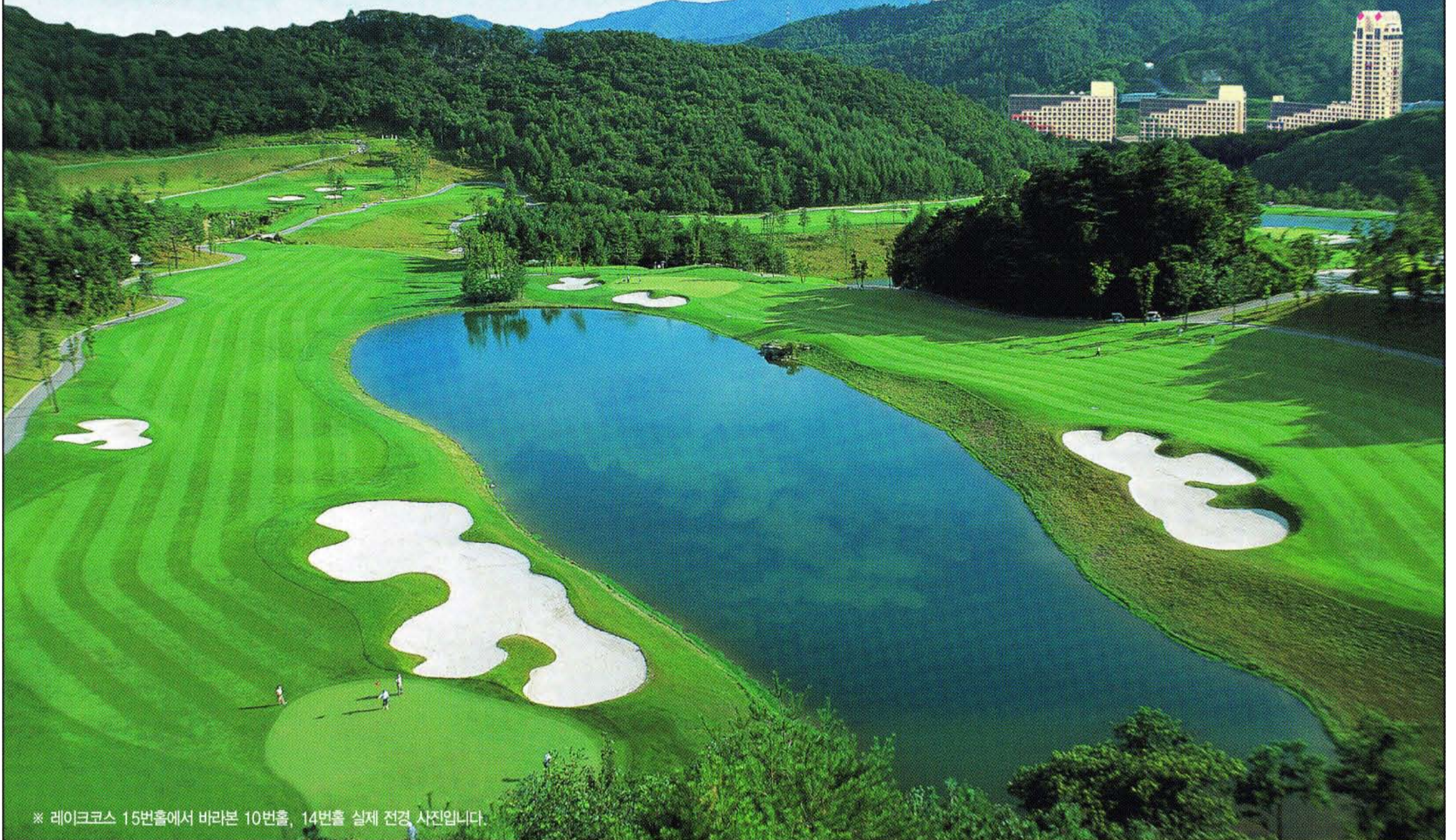
※ 레이크코스 15번홀에서 바라본 10번홀, 14번홀 실제 전경 사진입니다.