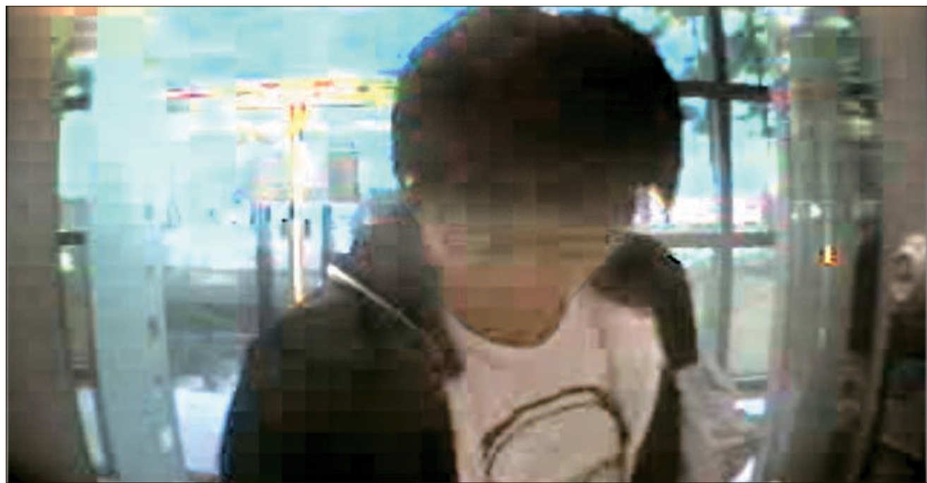
지난 8일 서울 구로동의 농협 구로지점 현금인출기에서 한 남성이 현대캐피탈이 송금된 1억원 중 일부인 600만원을 인출하는 모습이 CCTV 카메라에 포착됐다. 용의자들은 같은 날 오후 2시부터 6시 사이에 5개 계좌에서 3000만원을 인출했다.